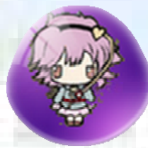
初音未來 3D IKA 強