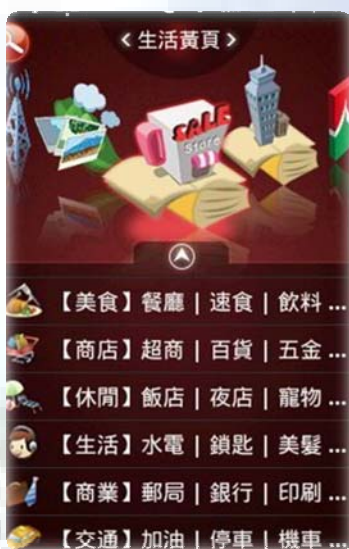
hiPage 搜 go!